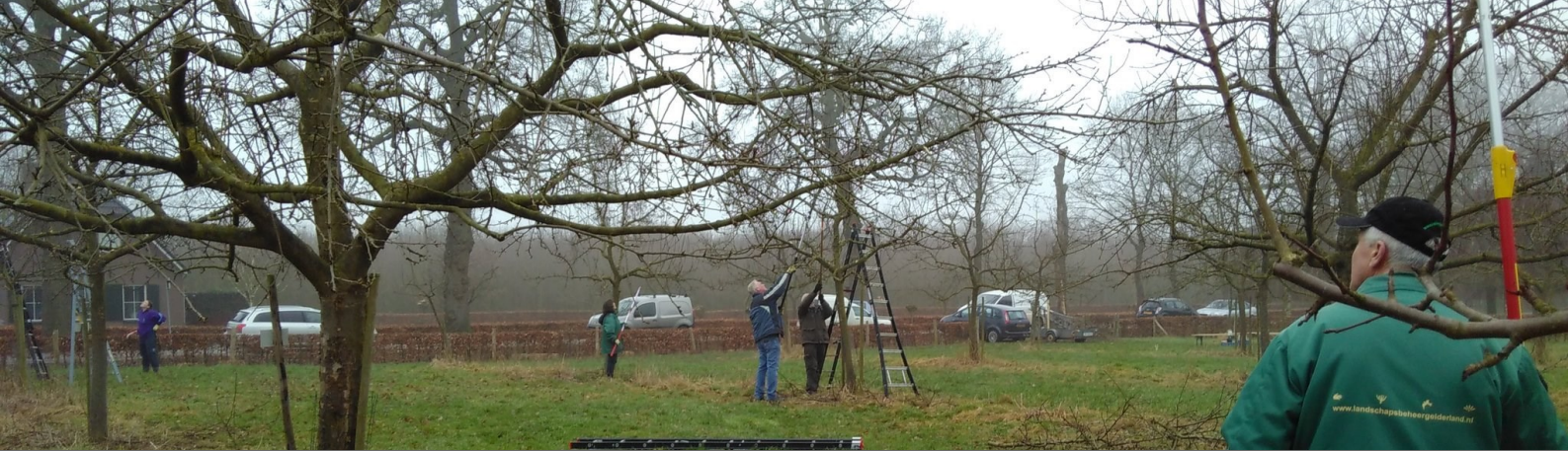
Hoogstambrigade Overbetuwe aan de slag in Hemmen