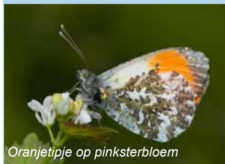
Oranjetipje op pinksterbloem