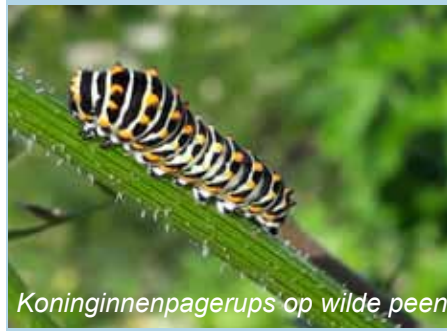
Koninginnenpacerups op wilde peen