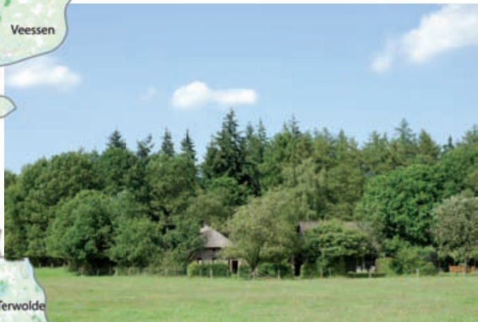
Bossen bij Gortel