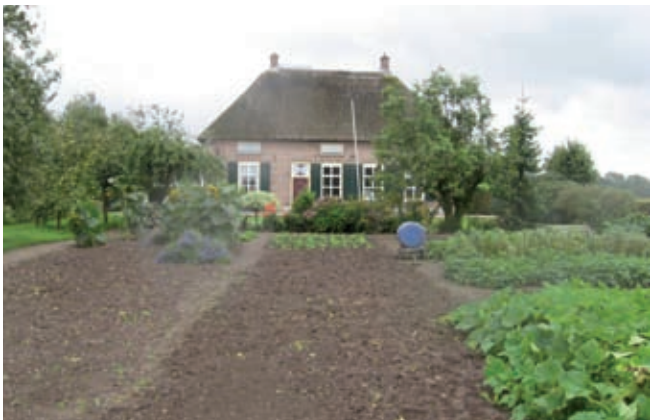
Moestuin en siertuin liggen achter elkaar.