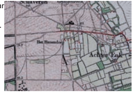
Landschap rond 1900

boerenland gaan maar ook landschappen met elkaar verbinden. Ook allerlei dieren profiteren van een aantrekkelijk landschap.