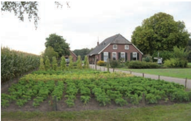
De moestuin ligt voor het huis.

Boerenerven betekenen veel voor het landelijk gebied. Tegenwoordig is er bij de grote en lange stallen een harde grens ontstaan tussen bebouwing en landschap. De gebouwen staan kaal in het land. Dit komt door het verdwijnen van beplanting op kavelgrenzen, door de vorm en maat van de gebouwen en door de toename van erfverharding. De visuele verandering op het achtererf is daardoor groot. De passant en u misschien ook, vindt het over het algemeen niet mooi. Ook voor op het erf is veel veranderd. De moestuin verdwijnt langzamerhand. Deze brochure geeft suggesties hoe u door het aanbrengen van beplanting deze veranderingen kunt verkleinen.