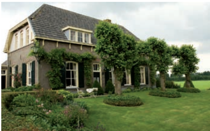
De moestuin is helemaal niet meer aanwezig.