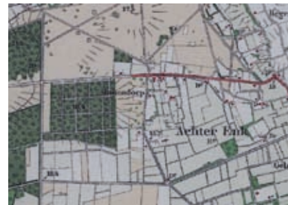
Landschap rond 1930