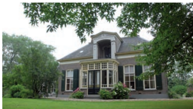
IJsselhoeve de Blankemate

Een bijzonder kenmerk zijn de IJsselhoeven op de oeverwal. IJsselhoeven zijn de karakteristieke boerderijen en erven in de IJsselvallei. Het zijn T-boerderijen, voornamelijk gelegen in het landschap langs de IJssel, met verschillende bijgebouwen zoals een of meerdere hooibergen, een houtschuur, een wagenloods, schuur, een bakhuis, een tanklokaal en kippenhok. Vaak zijn deze boerderijen via een doodlopend en beplant weggetje bereikbaar. Ook hier gold de indeling in 'voor' en 'achter'. Overigens moet deze indeling ook weer niet al te letterlijk worden genomen, zeker niet langs de IJssel. Als er geld verdiend werd, kwam er soms een grotere siertuin de zogenaamde slingertuin voor de voorgevel van de boerderij, waardoor het hele erf meer status kreeg. De moestuin en de boomgaard voor eigen gebruik verhuisden naar de zijkant van het erf.